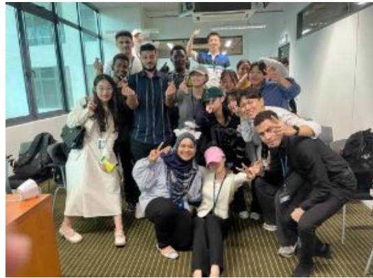
기말 고사 끝난 후 단체 사진 2