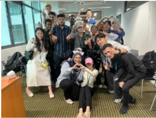
기말 고사 후 단체 사진