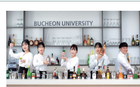
Lớp thực hành F&B

# Barista # Lớp thực hành # Thử làm nhân viên pha chế # Trải nghiệm lớp học pha chế # Môi trường học giống như quán cà phê # Cà phê